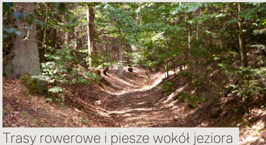
Trasy rowerowe i piesze wokół jeziora

W okolicznych lasach spotkać można stado żubrów, wytropić wilka czy rysia.