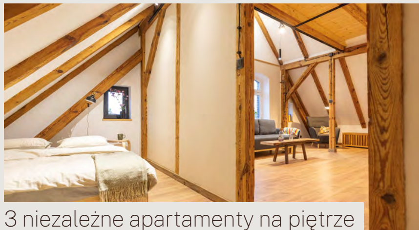
3 niezależne apartamenty na piętrze

W razie konieczności kanapa może posłużyć jako łóżko dla kolejnych 2 osób.