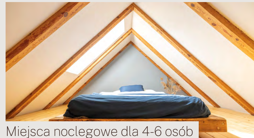
Miejsca noclegowe dla 4-6 osób