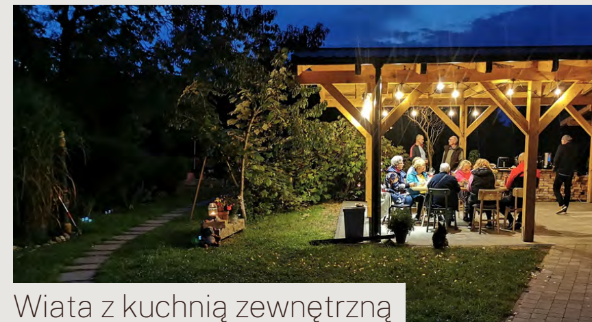
Wiaty z kuchnią zewnętrzną