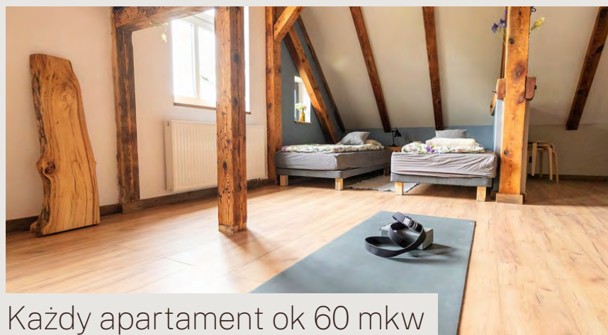
Każdy apartament ok 60 mkw