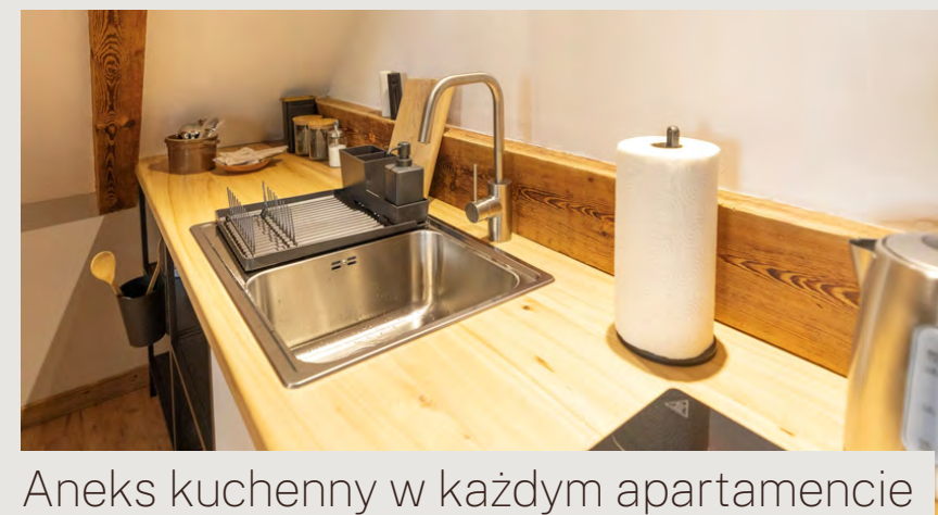
Aneks kuchenny w każdym apartamencie