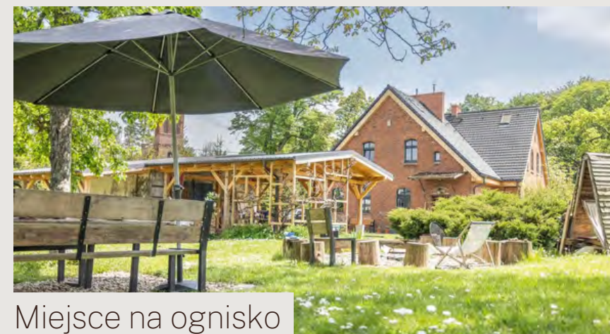
Miejsce na ognisko