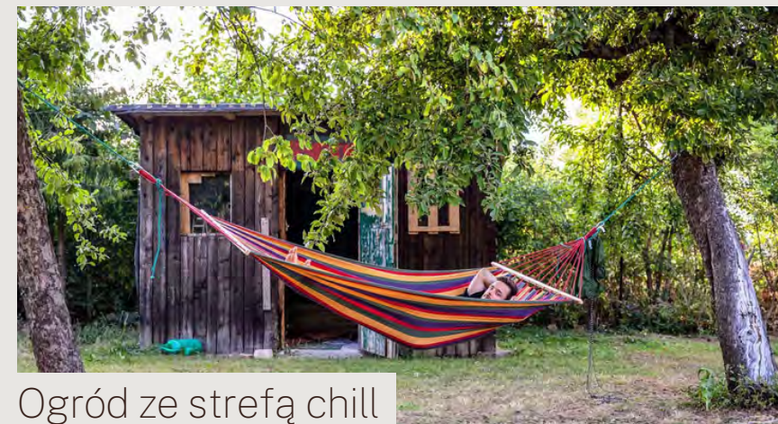
Ogród ze strefą chill