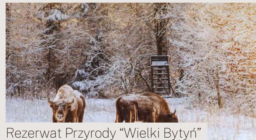
Rezerwat Przyrody "Wielki Bytyń"