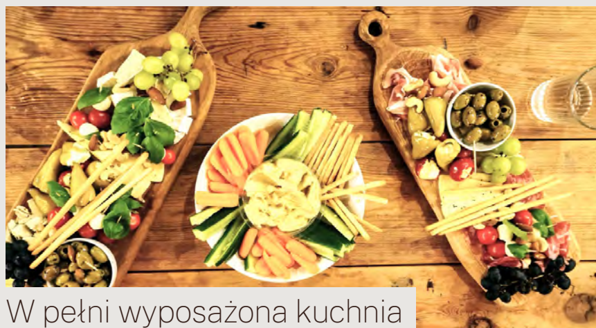
W pełni wyposażona kuchnia